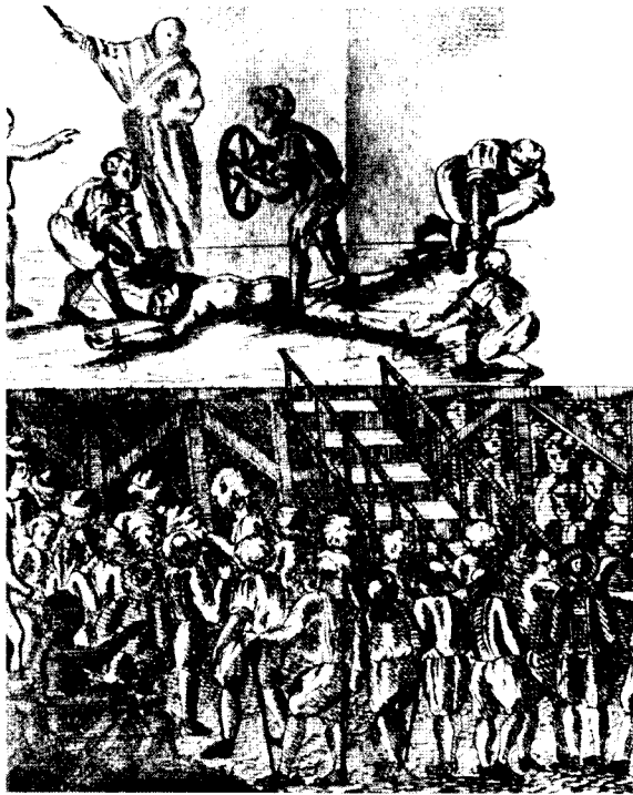
Afb. 6 Een radbraking (detail van een gravure van Friedrich August Scheureck, 1781).

lichaam worden gehakt. Het lichaam moest met twee kettingen op een rad worden vastgemaakt en als afschrikwekkend voorbeeld blijven liggen. Het hoofd moest op een paal naast het lichaam gestoken worden. Drie dagen later willigde landsheer Johan Wilhelm vanuit Düsseldorf echter het verzoek van Peerboom om een barmhartige sententie in. Het vonnis bleef ongewijzigd, maar uit genade moest de eerste slag bij het radbraken op het hart worden gegeven, zodat op dat moment de dood in zou treden.