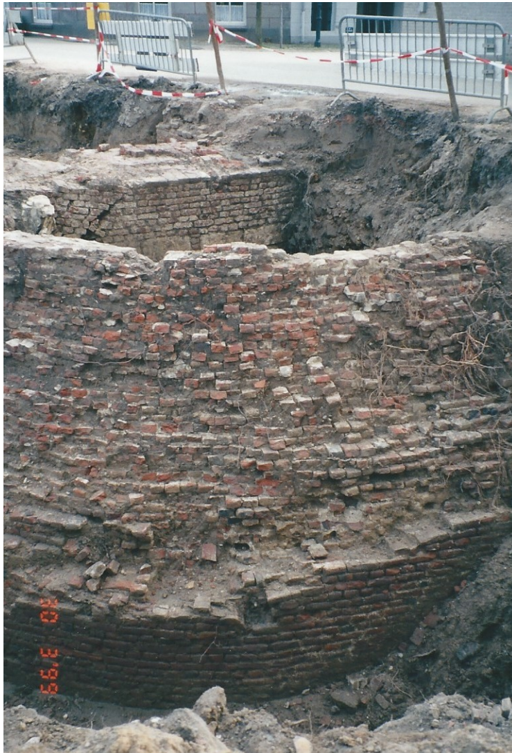
Het Bokrondeel tijdens de opgraving in 1999

gedeeltelijk ontmanteld, waardoor de oorspronkelijke vorm van de buitenzijde moeilijk te reconstrueren is.