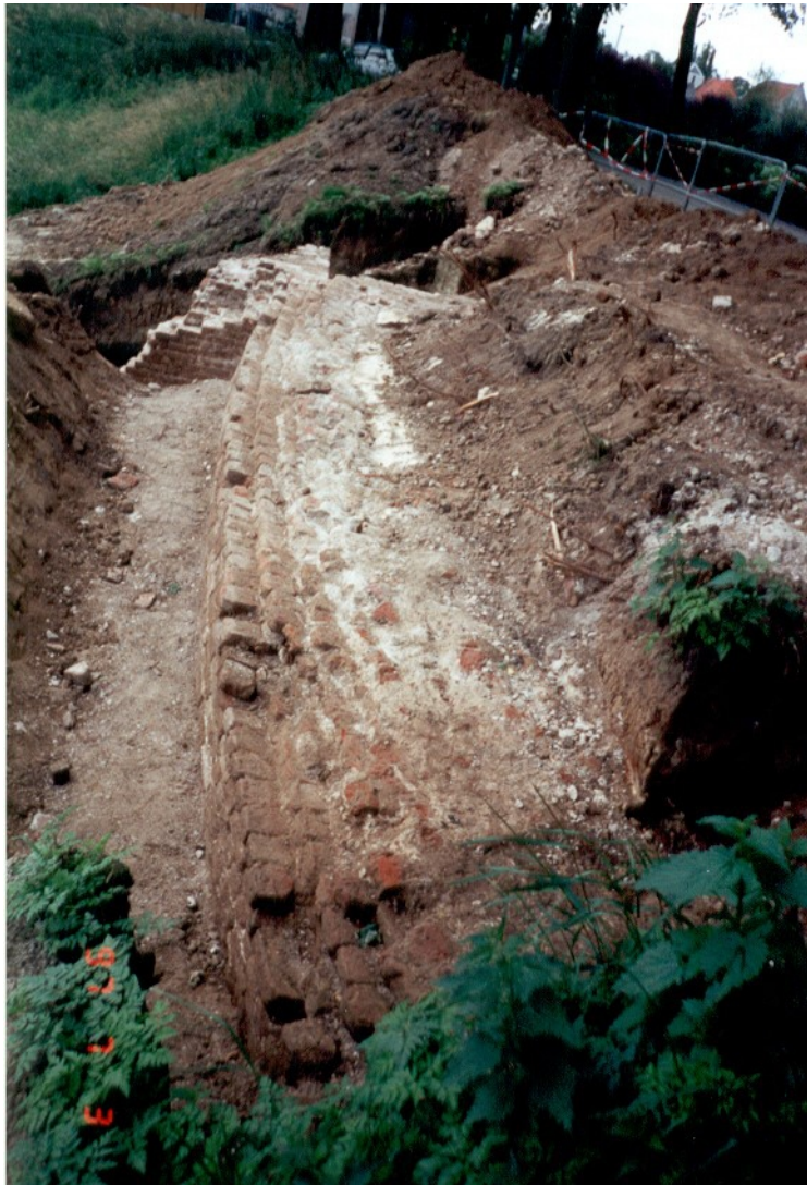
Het Kasteelrondeel tijdens de opgraving in 1997

De restanten van de dit rondeel liggen aan de Maasdijk, nabij de van Coothweg. Het heeft een onvolledige cirkelvormige plattegrond met rechthoekige uitbouw. Wat de functie was van de uitbouw met geschutskelder is niet bekend. Onder het maaiveld bevinden zich o.m. een overwelfde ruimte met schietgat. De restanten bestaan grotendeels uit baksteen voor de buitenzijde waarbij ter hoogte van de waterlijn Namens hardsteen is verwerkt ter bescherming tegen erosie van het rivierwater. Inwendig zijn mergelblokken verwerkt, vanwege hun vonkvrije eigenschappen en mergel was goedkoper dan baksteen. De muren zijn 3,5-4 meter dik. Het had een diameter van ca 42 meter. Het rondeel liep waarschijnlijk door tot aan de rand van de weg aan de stadskant. In deze hoek zijn muurresten aangetroffen. Daar sloot het rondeel mogelijk aan op de wal of vestingmuur langs de Maasdijk. Verder onderzoek zou daar klaarheid over kunnen geven.