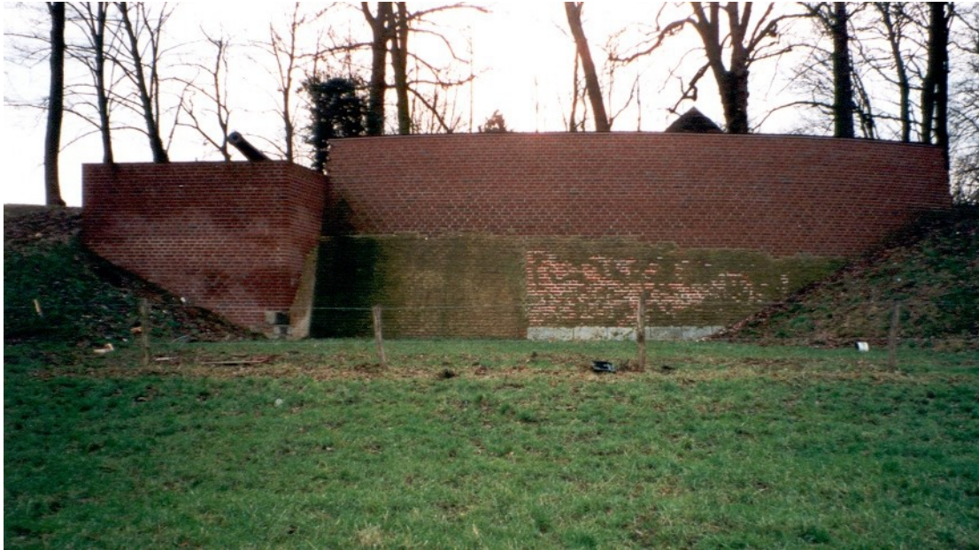
Het gerestaureerde Kasteelrondeel met de rechthoekige uitbouw in 2001

de vestingbouw. Beide rondelen zijn, terecht, een Rijksmonument (nmer 513537). In 1999 zijn de beide rondelen gerestaureerd.